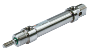
ISO 6432 roestvaststaal cilinder, diameters 16 tot 25 mm

Vérins en acier inoxydable suivant la norme ISO 6432 diamètres du 16 au 25 mm