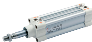
ISO 15552 cilinder type HCR, hoge corrosiebestendigheid, diameters 32 tot 125 mm

Vérins en acier inoxydable suivant la norme ISO 6432 diamètres du 16 au 25 mm